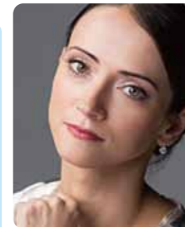
春日野すがるをとめ