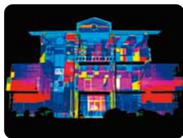
プロジェクションマッピング by ZERO-TEN

本作品の美術には、日本を代表する洋画家、絹谷幸二氏が本作の為に作品「飛鳥に寄せて」を制作しました。これを基にした映像演出によって創り上げる舞台空間は、ファンタジーの世界に繋がる壮大ないにしへの都。日本が誇るオペラ・バレエの劇場、新国立劇場の充実した舞台空間で、古来の日本の美と最新のメディアアートが融合する新しいバレエの世界が誕生します。