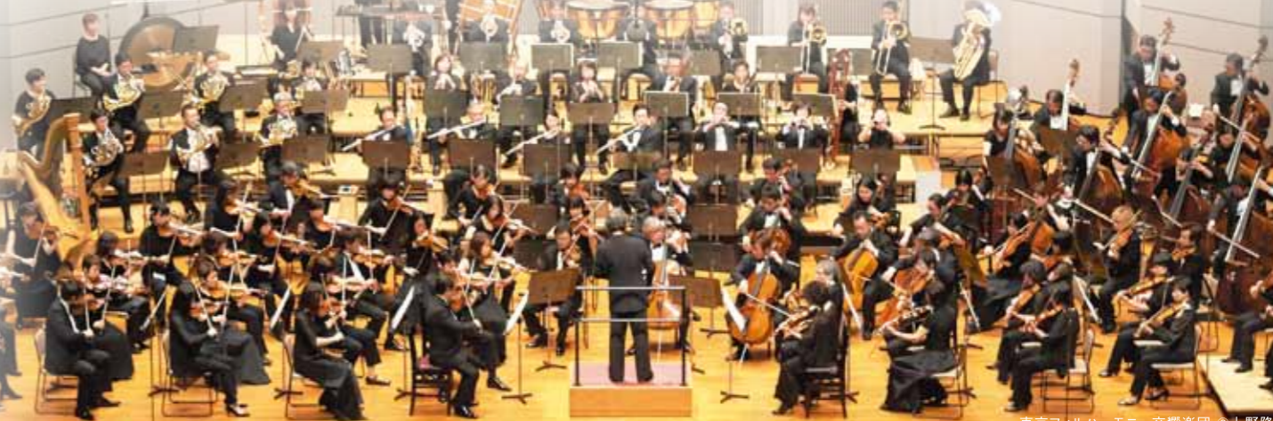
東京フィルハーモニー交響楽団 © 上野隆文